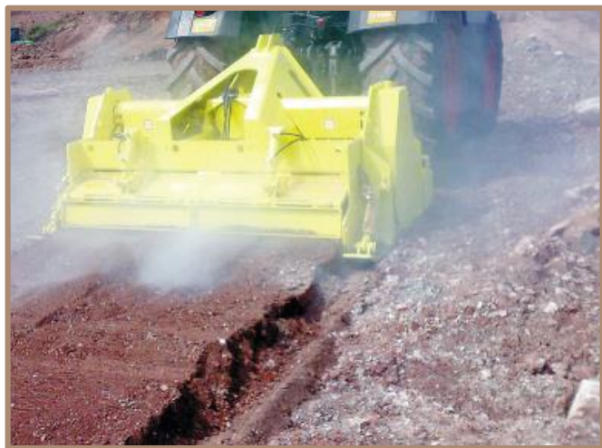
RBM - S