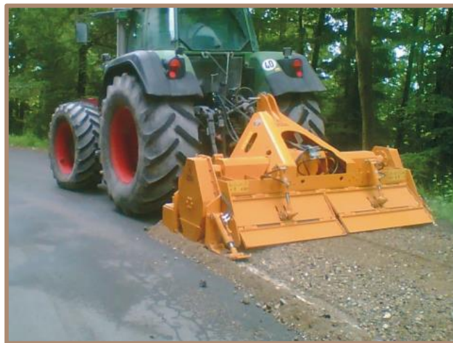
RBM - M