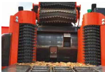
Rouleaux d'entraînement et table d'alimentation à chaînes