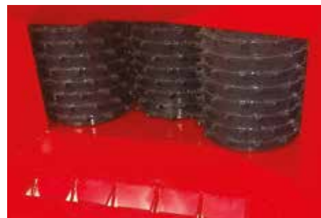
3 rouleaux d'entraînement