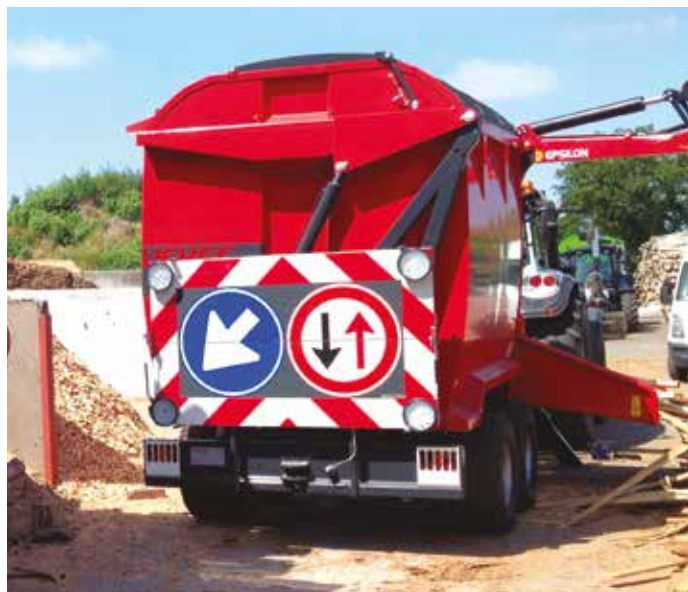
Panneaux de signalisation à l'arrière