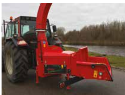
Béquille et table d'alimentation repliables hydrauliquement