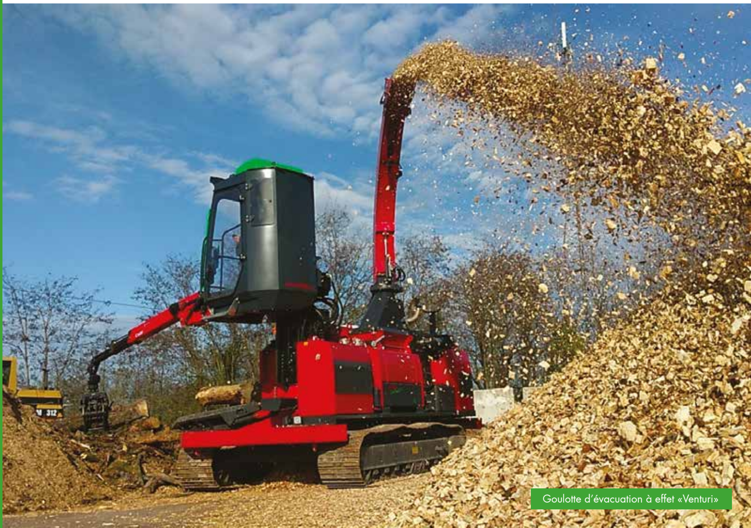
Goulotte d'évacuation à effet «Venturi»