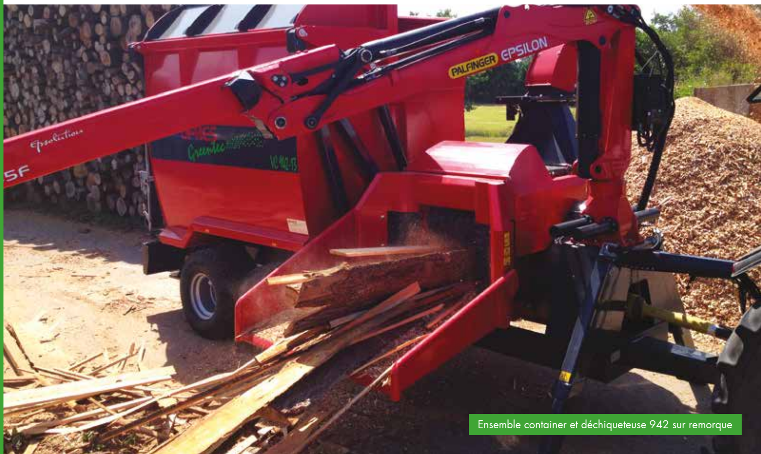
Ensemble container et déchiqueteuse 942 sur remorque