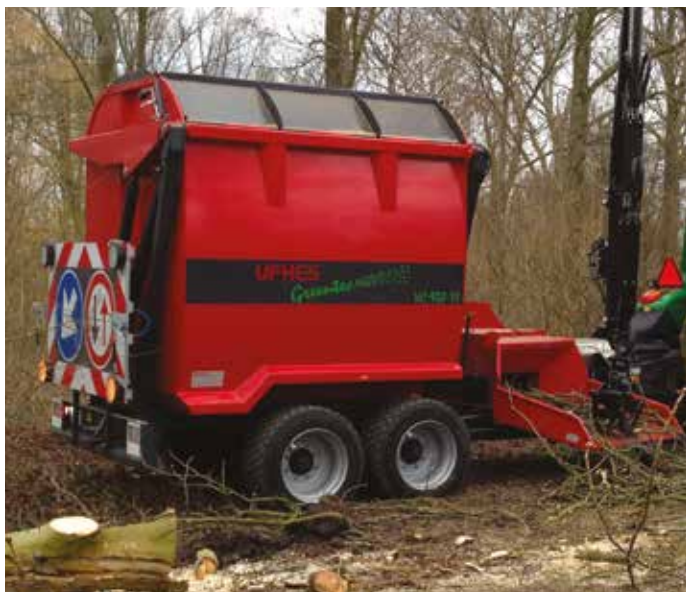
Chantier en forêt

Les containers apporte une réelle autonomie et facilitent certains chantiers : en forêt, là où les camions à fond mouvant ne peuvent intervenir, servir de stock tampon entre 2 camions, éviter des rotations de camions chargés de branches en ville ou en bord de route ou tout simplement pour livrer directement des chaufferies.