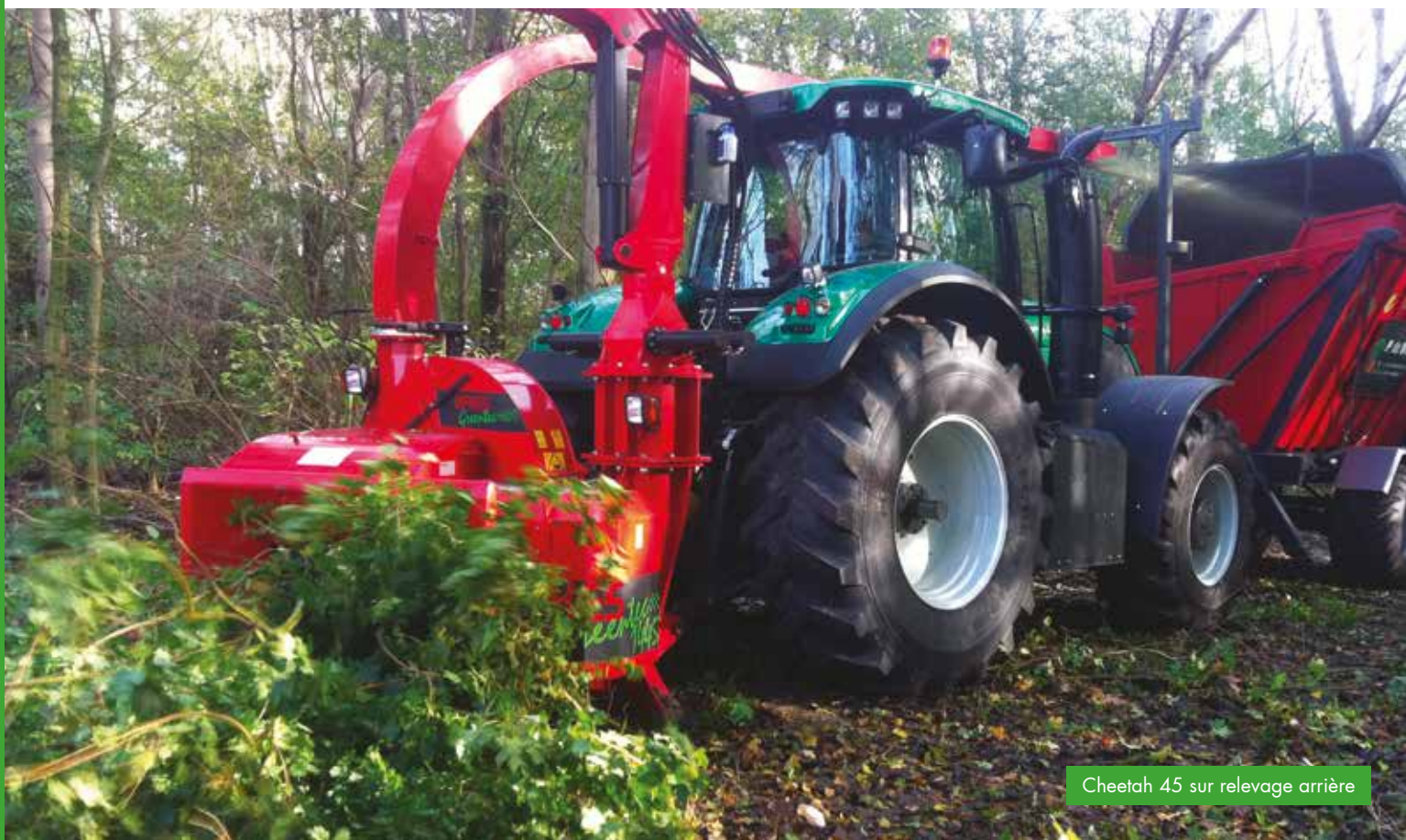
Cheetah 45 sur relevage arrière