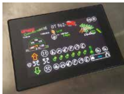
Écran de contrôle intuitif