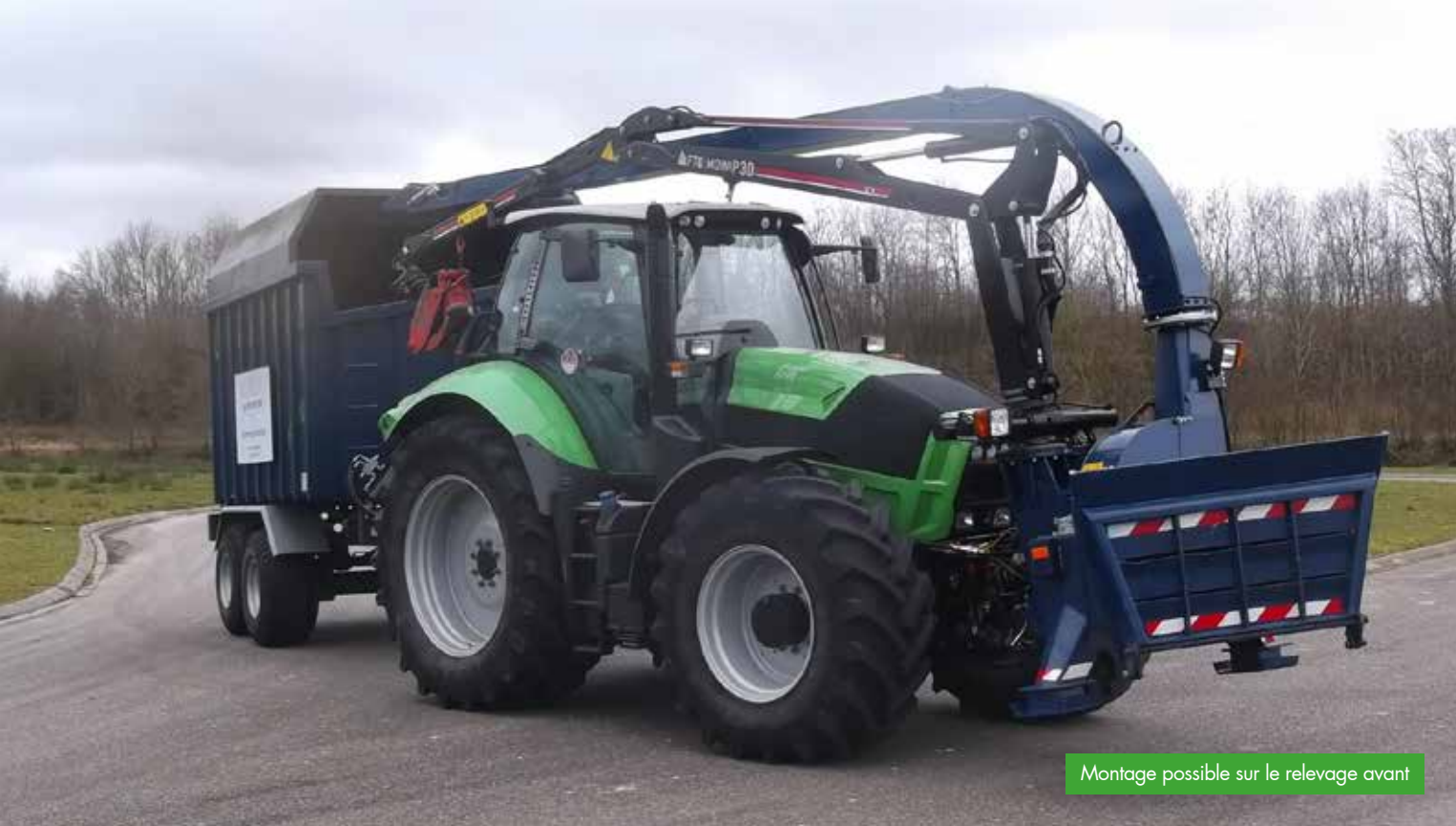
Montage possible sur le relevage avant