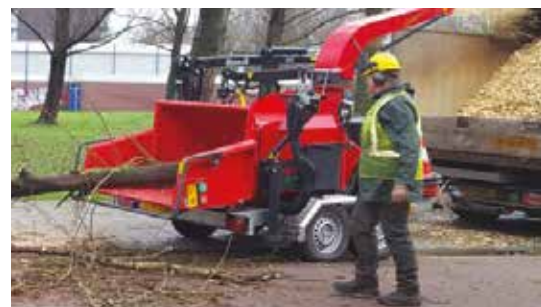
Alimentation manuelle - en option