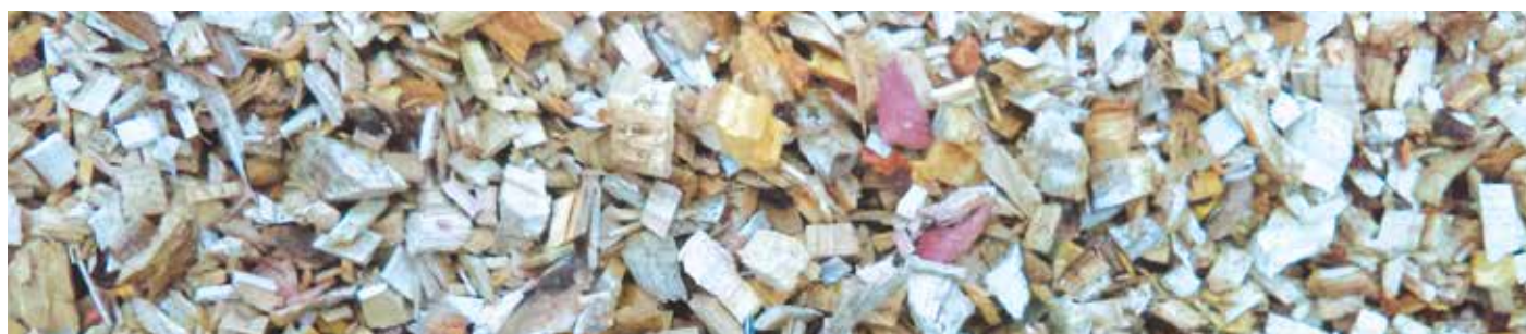
Plaquette de haute qualité G30